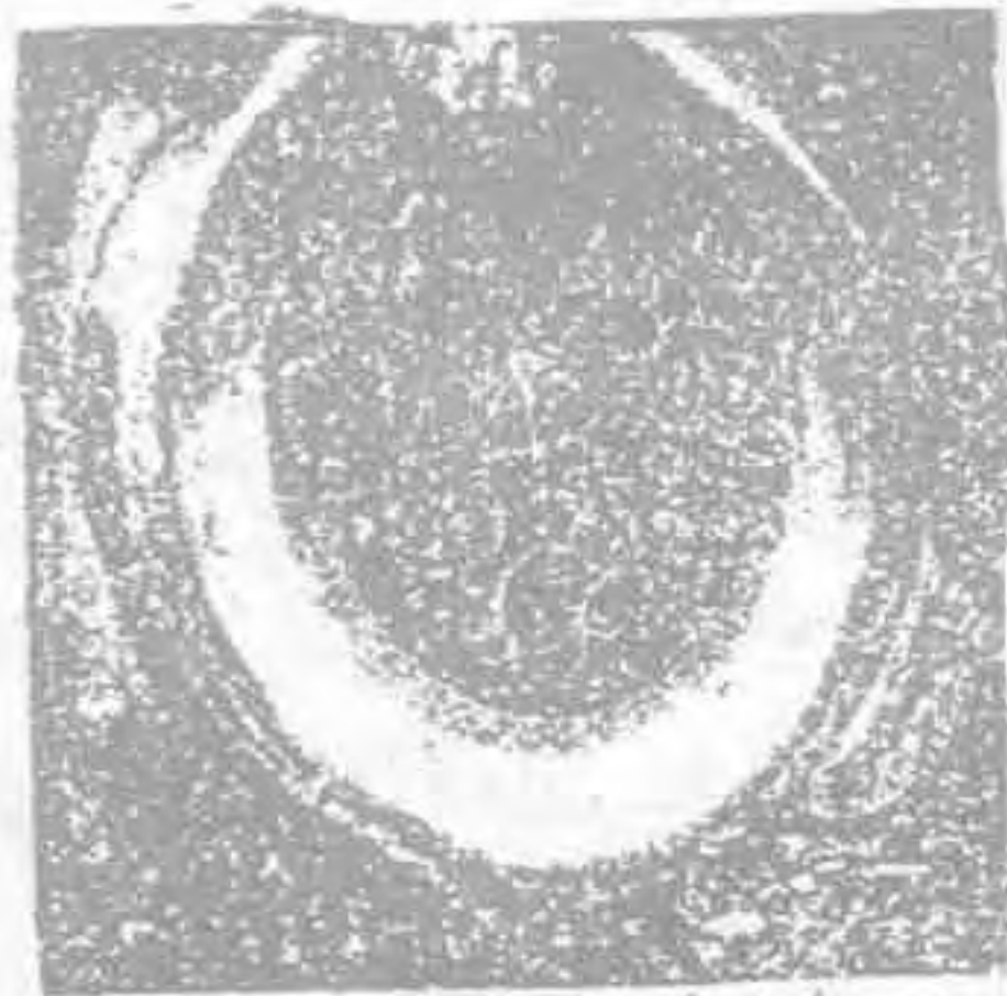
حجر اسود کے آٹھ ٹکڑوں کو بڑا کر کے نمایاں کیا گیا ہے

حجر اسود شروع میں ایک ہی تھا اب اس کے چھوٹے چھوٹے آٹھ ٹکڑے ہیں، ان ٹکڑوں کو پتھر کے بڑے ٹکڑے میں جوڑا گیا ہے اور پھر اس پر چاندی کا فریم لگا دیا گیا ہے، یہی وہ ٹکڑے ہیں جن کو بوسہ دینا مسنون ہے، نہ کہ وہ بڑا پتھر اور نہ ہی چاندی کا وہ خول جو اس بڑے پتھر پر چڑھا ہوا ہے۔